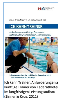
Ich kann Trainer: Anforderungen an künftige Trainer von Kaderathleten im langfristigen Leistungsaufbau (Zinner & Krug, 2011)