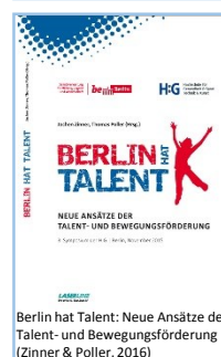
Berlin hat Talent: Neue Ansätze der Talent- und Bewegungsförderung (Zinner & Poller, 2016)