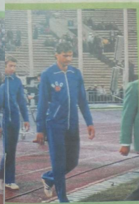
Flaggenparade zur Siegerehrung. So sah es oft aus: Zweimal DDR und ein anderes Land auf dem Platz.