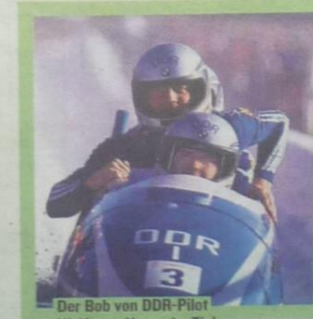
Der Bob von DDR-Pilot Wolfgang Hoppe im Ziel.