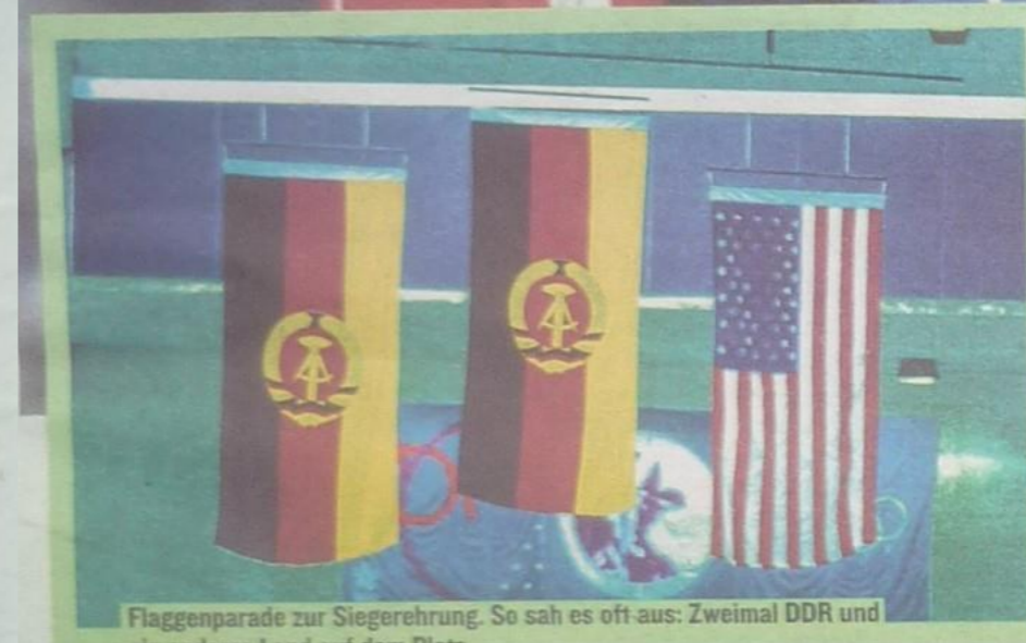
Flaggenparade zur Siegerehrung. So sah es oft aus: Zweimal DDR und ein anderes Land auf dem Platz.