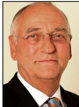
Klaus Böger Präsident des LSB Berlin